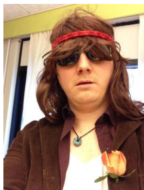
Samme lærer i to forskellige årtier